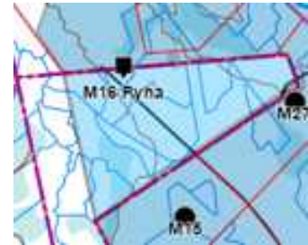
Kuva 2. Pyhäjärvi Nurmesnevan alustava suunniteltu hankealue, joka sisältää Pyhäjärven enklaavin (oikea kuva)