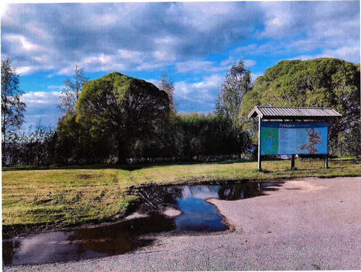
Levähdyspaikan parkkialueelta järvelle päin. Kuvassa myös Pyhäjärven palvelutaulu, joka vaikuttaisi olevan ajan tasalla.